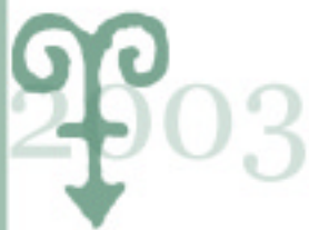
附錄 9 臺閩地區各縣市歷史建築一覽表(續 6)