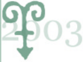
附錄 22 各國文化指標和 UNESCO 文化指標體系比較 (續完)