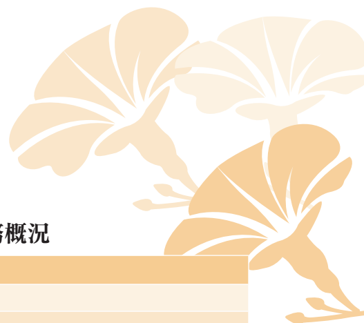
表A-1-1 2016年、2017年文化部職掌業務概況